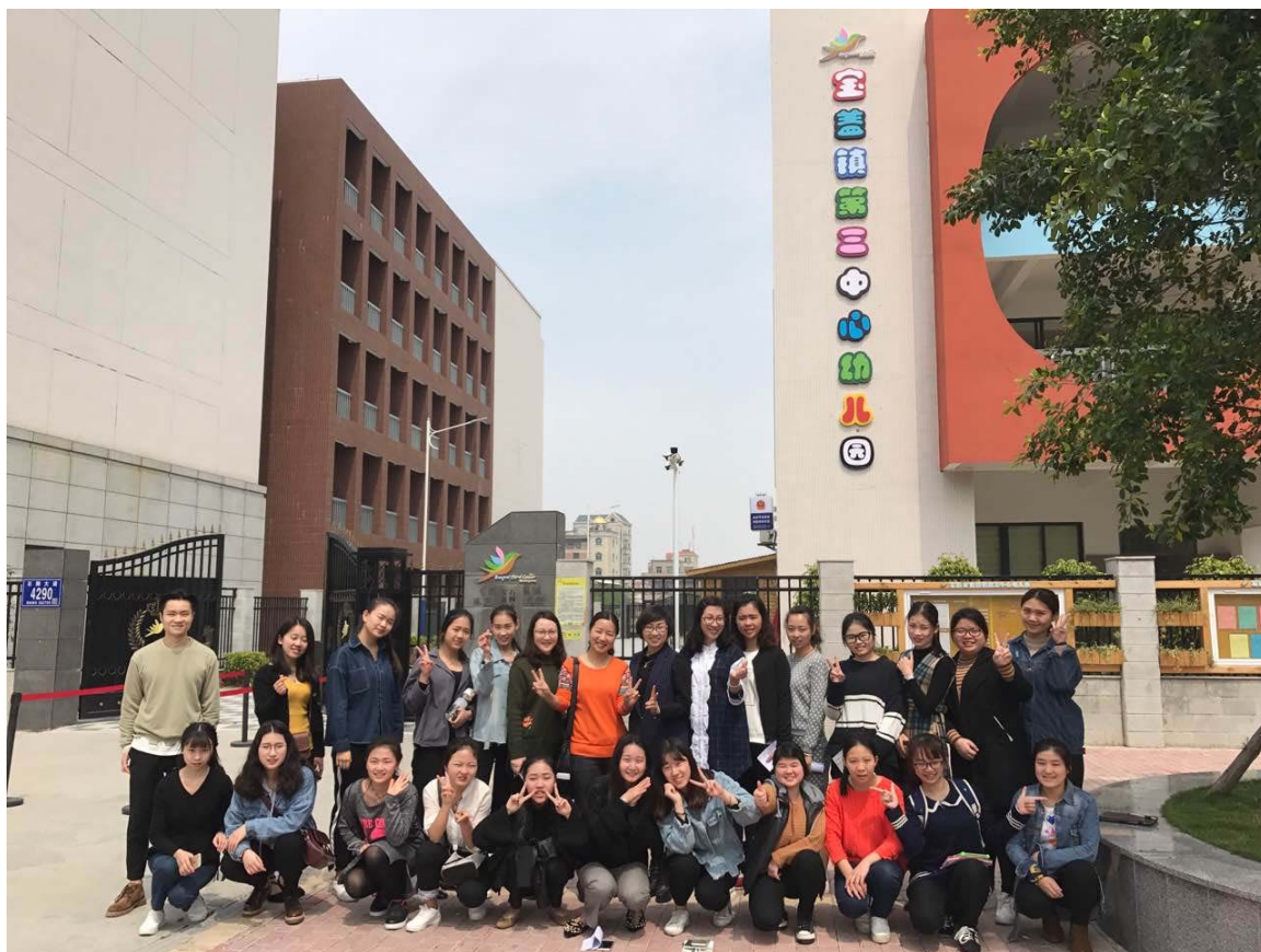
图 3 表演艺术专业学生在合作企业进行顶岗实习

由于现代学徒制和“二元制”试点项目，在我院只有部分专业参加改革试点，其他专业限于省厅计划仍然是按原有的人才培养模式进行。项目组会同教学单位，对有良好的合作企业的专业开展校内试点。其中，酒店管理、社会体育和表演艺术三个专业的试点推进比较顺利。由于合作企业能够为学生提供足够的工作岗位并愿意支付学生顶岗实习的工资，专业负责人对原培养方案进行了大幅度的调整，就目前情况来看，这个举措是成功的。学生参与新的人才培养模式积极性很高，教学效果明显。这些校内试点专业参照获批的国际邮轮乘务管理专业的做法，在专业课程体系的重构、教学过程的实施、课程考核评价的改革以及学生的管理等方面进行改革。表演艺术专业重新修订了人才培养方案，增加了专业实践教学课时的比例，并将在校学习时间减少为一年半，部分专业核心课程直接在合作企